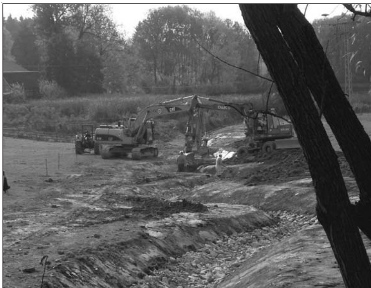
Erstmals in der Verwaltungsgemeinschaft wurde ein verrohrter Bachlauf wieder geöffnet. Als Ausgleichsmaßnahme für den ländlichen Wegebau in Burkersdorf wurde die defekte alte Rohrleitung entfernt und durch ein geräumiges Bachbett ersetzt.

Zu Beginn des Jahres wurden die Gemeinden regelrecht genötigt, Anträge über Anträge zu stellen, da in diesem Jahr viel Geld zu Verfügung stehe. Die Gemeinden freuten sich und taten das, was ihnen empfohlen wurde. Die Vorfreude auf große Taten begann und sie dauerte und dauerte, bis schließlich erst Mitte Juli (!!!) endlich die Förderbescheide ins Haus flaterten. Jetzt konnten die Planungsbüros loslegen, die Ausschreibungsunterlagen vorbereiten. Die ersten Submissionen (Eröffnung der Angebote) fanden Mitte August, die letzten einen Monat später statt. Der Baubeginn für alle Maßnahmen, die mit ländlichem Raum zu tun haben, war schließlich Anfang September. Jetzt hieß es aber Druck machen, auf die Planer und gemeinsam mit ihnen auf die Baufirmen, denn die sollen es nun schaffen, verloren gegangenen Boden wieder gutzumachen. Schließlich ist der Oktober bald ran und da müssen am 31. die Baustellen auch wieder abgerechnet sein. Mit diesen Terminen von „Oben“ ist nicht zu spaßen, denn auch die Fördermittelverwaltung namens Amt für Landentwicklung und Flurbereinigung, die, jedoch genauso gebeutelt wie wir, genauso