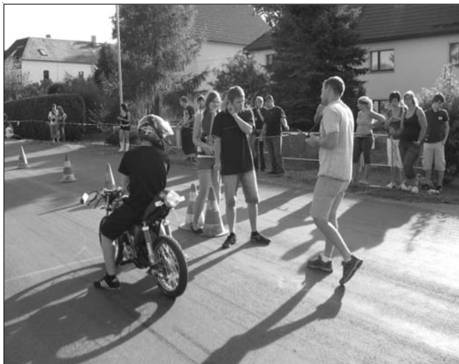
Ihr und euer Jugendwart