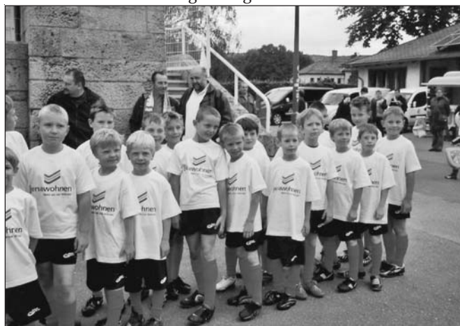
Ungeduldig warten die Oettersdorfer Kicker im Jenaer Stadion auf ihren Einsatz.

Der FC Carl Zeiss Jena hatte die jungen Sportler eingeladen, damit sie als Eskorte Hand in Hand mit den Profifußballern beim Spiel der 3. Bundesliga Jena gegen Stuttgart auf das Spielfeld laufen und an der Begrüßungszeremonie teilnehmen.