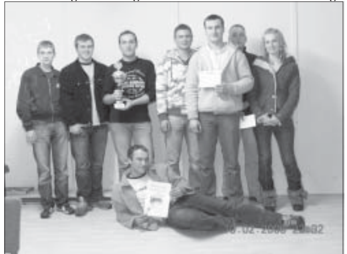
Tegauer Siegeream Schönstes Jugendobjekt 2005

Den 3. Platz belegten die Jugendlichen aus Oettersdorf mit einer Punktzahl von 16. Auf 18 Punkte und Platz 2 brachten es die Neundorfer. Nach dem Titel 2001 ist es den Tegauern nun gelungen, als erster Jugendclub zum zweiten Mal die Trophäe mit 26 (von max.30) Punkten in ihre Gefilde zu holen. Tegau bleibt weiterhin der einzige Club, der sich bisher in allen 8 Auflagen des Wettbewerbs mit kleineren und größeren Arbeiten eingebracht hat. Im vergangenen Jahr wurde der Raum innen mit Laminat ausgelegt, gefließt, der Innenraum neu gemalt, ein neues Vordach geschaffen und eine gemütlicher Partyplatz für die Sommermonate geschaffen. Die Jury und das REGIO-Team für Jugendarbeit gratulieren recht herzlich zum Erfolg!