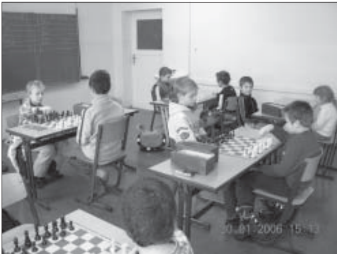
Fünf Paarungen Oettersdorf-Moßbach beim Denksport Schach